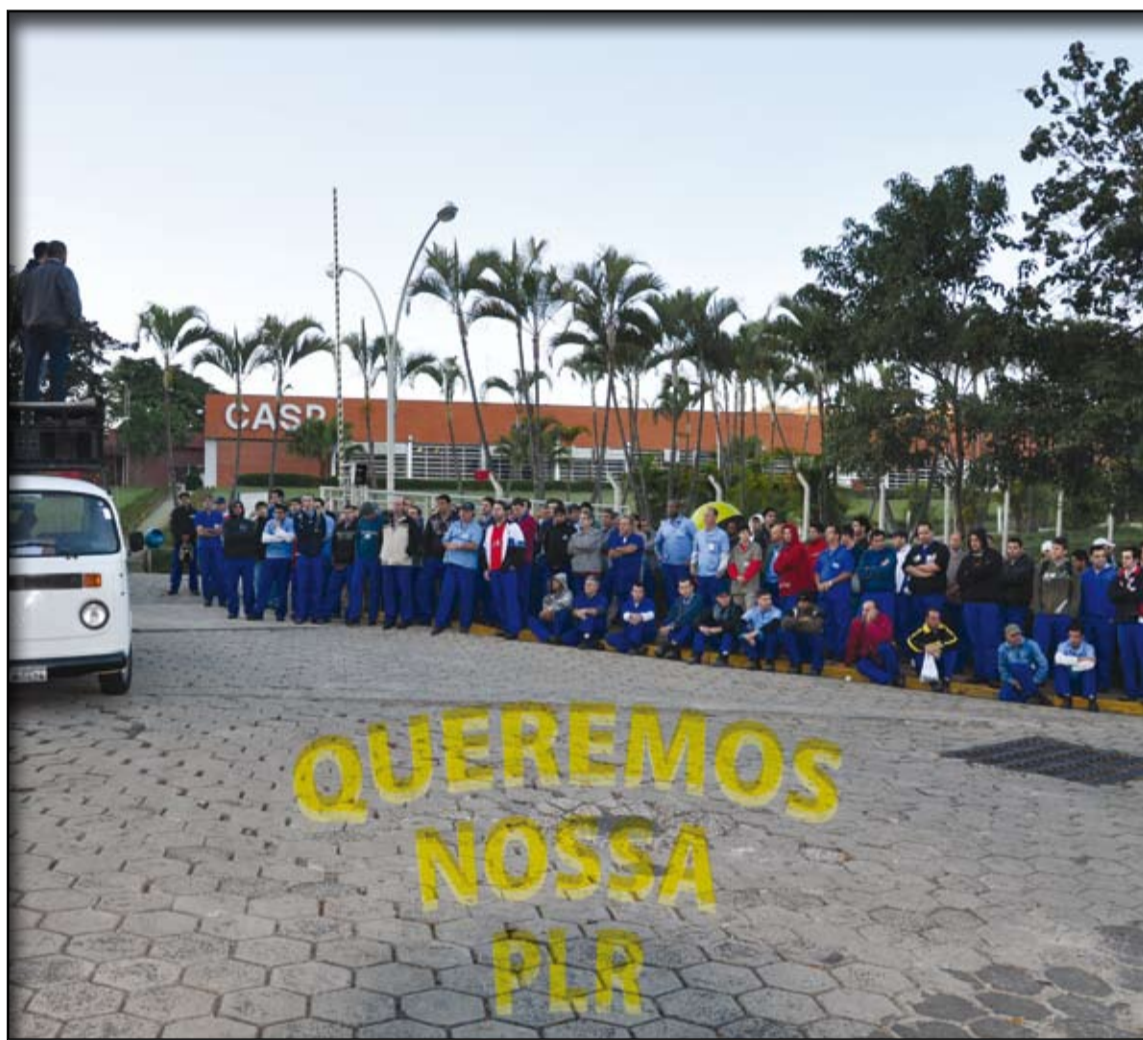
TRABALHADORES EM ASSEMBLEIA ELEGEM COMISSÃO E PAUTA DE NEGOCIAÇÃO