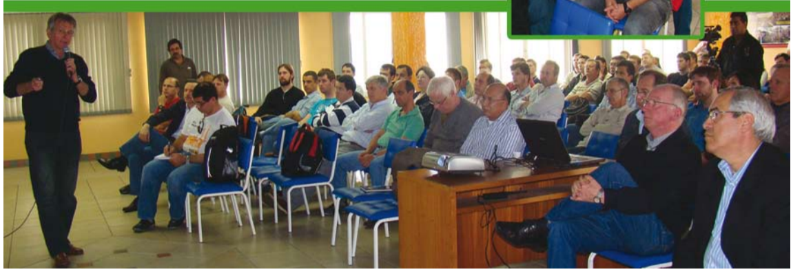
O SINDICATO PARTICIPOU DAS DISCUSSÕES QUE VISAM ATUALIZAR E APRIMORAR A NORMA REGULAMENTADORA Nº 13 DO MINISTÉRIO DO TRABALHO

tratadas na Comissão Tripartite do Ministério do Trabalho que discute o tema e da qual o SindMetal faz parte como membro representante dos trabalhadores.