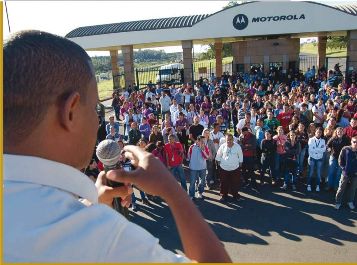
EMPRESA JÁ INICIOU A DEMISSÃO DE 220 EMPREGADOS EM JAGUARIÚNA; SINDICATO NEGOCIOU MEDIDAS PARA COMPENSAR OS DISPENSADOS