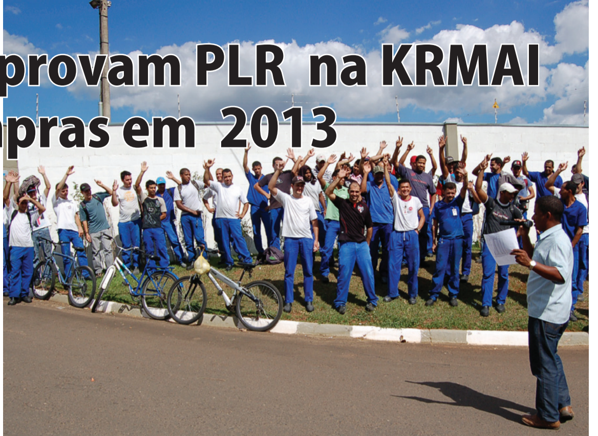
NO ANO, O VALE-COMPRAS DARÁ R$840,00 A MAIS PARA CADA TRABALHADOR

Proposta aprovada estabelece PLR de R$ 600 mais vale compra de R$ 70 a partir de fevereiro do ano que vem.