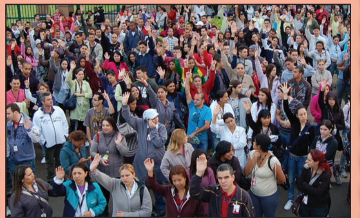
JUNTOS SOMOS FORTES!

Se não há mobilização, não há vitória. Esta lei do movimento sindical mais uma vez provou que é precisa. Em duas empresas da base, Casp, em Amparo, e Freeart, em Jaguariúna, não houve avanços nas negociações da PLR deste ano e a reação contrária dos trabalhadores acabou sendo passiva.