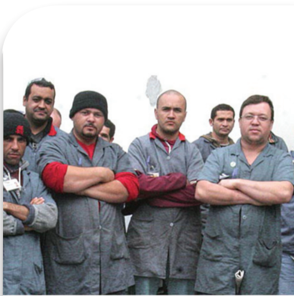
MUITAS GREVES AINDA IRÃO ROLAR

Indignados diante da tentativa das empresas em empurrar apenas a inflação ou um aumento real insignificante sobre os salários, várias paralisações ainda devem ocorrer. Os setores de autopeças, máquinas, equipamentos e eletroeletrônicos, por exemplo, propõem