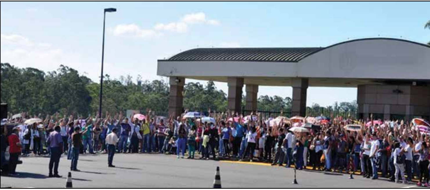
Depois de uma negociação exaustiva - cerca de 5 meses trabalhadores comemoram conquista com Sindicato

Trabalhadores dos 3 turnos da Flextronics (Jaguariúna) aprovaram Participação nos Lucros e Resultados (PLR) após 5 meses de negociações. Em assembleia realizada no dia 5 de outubro chega ao fim a negociação quando os trabalhadores aceitaram a mais recente proposta da empresa, de 2.500 reais, depois de diversas reuniões onde pouco se avançava. Entretanto, com a força do Sindicato e a mobilização de todos aos poucos a empresa foi recuando até chegar no valor que contentasse à maioria.