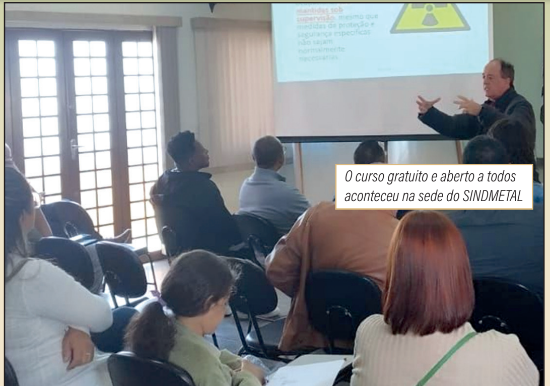
O curso gratuito e aberto a todos aconteceu na sede do SINDMETAL

"Enfatizamos que empresas que são subcontratadas para a prestação de serviços também devem seguir os critérios estabelecidos pela NR5 - CIPA, devendo estar integradas à CIPA da empresa principal. Também destacamos como ocorreu o processo de revisão das Normas Regulamentadoras no úl-