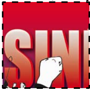
Selo 2C (edição 116)