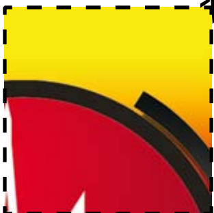
Selo 1A (edição 115)