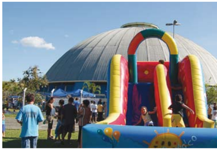
Uma festa especial para os sindicalizados e sua família

Diferente dos outros anos, quando acontecia sempre no 1º de Maio e era aberta ao público em geral, a festa desta vez será realizada exclusivamente para o trabalhador metalúrgi-