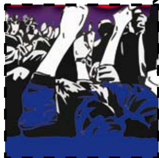
Selo 3C (edição 115)