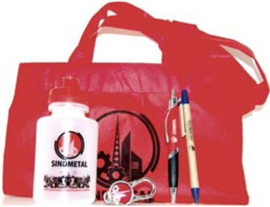
Promoção Cartela Premiada: recorte, cole e ganhe

Antigos e novos sindicalizados concorrem a prêmios no final do ano, além de receber brindes exclusivos do SindMetal