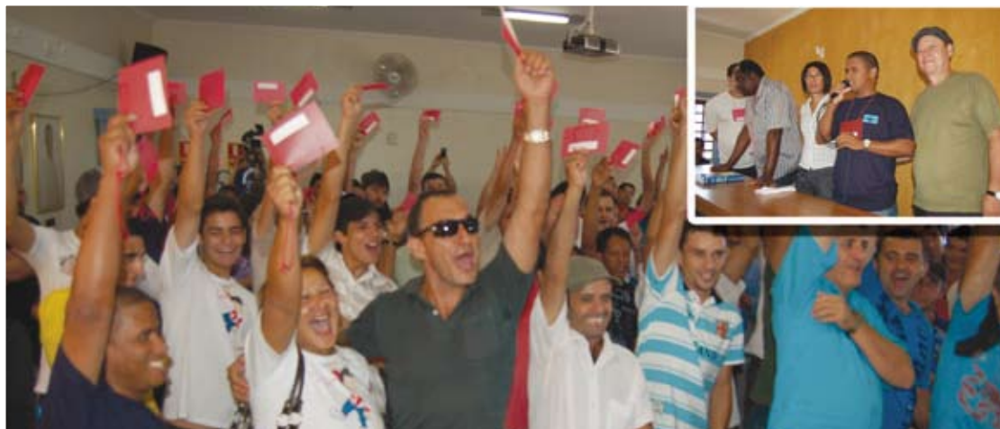
Assembleia Geral do dia 10 de abril foi decisiva no julgamento