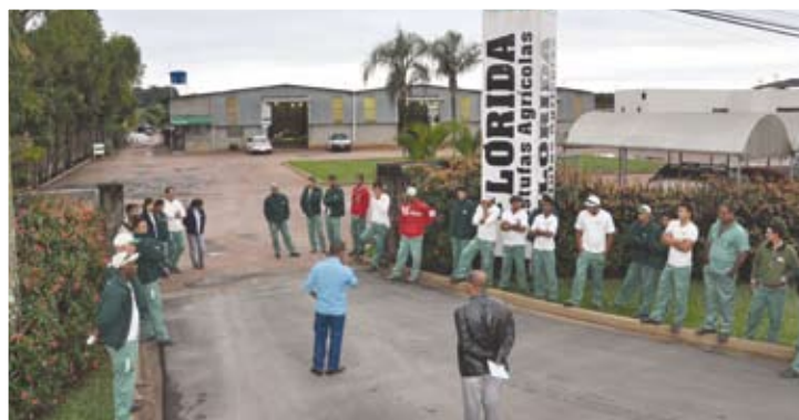
Trabalhadores da Flórida iniciam negociação com 800 reais

Na Delphi , após diversas reuniões realizadas no Sindicato e na própria empresa, as propostas são de aumento de 13,74% na PLR inicial (R$ 2,4 mil), 11,11% na PLR central (R$ 2,5 mil) e 10,63% na PLR superior (R$ 2,6 mil).