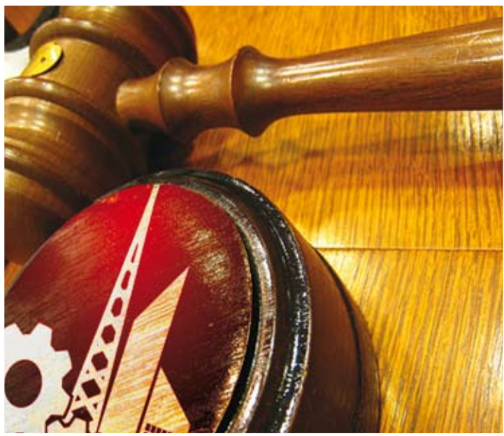
A decisão judicial encerra as pretensões do ex-presidente

A decisão judicial põe fim às pretensões do ex-presidente e encerra definitivamente seu ciclo à frente do SindMetal