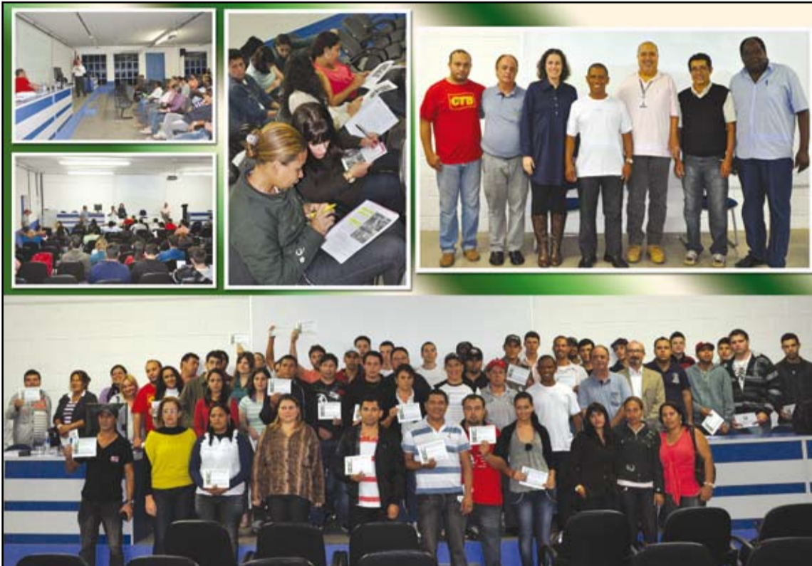
O curso reuniu dezenas de interessados em aperfeiçoar os conhecimentos em Segurança do Trabalho

Consciente da importância desta formação, no último dia 26 de maio, o SindMetal promoveu, no auditório do Centro Universitário Unifia de Amparo, o seminário "CIPA e Acidentes de Trabalho". Cerca de 100 trabalhadores e estudantes participaram do mini-curso, que contou com a presença de especialistas e profissionais da área de saúde e segurança no trabalho abordando aspectos como a legislação e âmbitos jurídicos, atu-