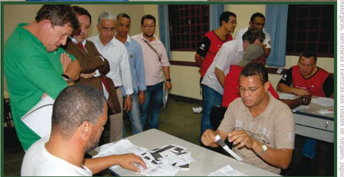
Apuração dos votos com representantes das duas chapas

de 3 urnas por ter havido divergências relacionadas a assinaturas de cédulas entre os escrutinadores. Como não poderiam mais alterar o resultado final, a vitória da Chapa 1 foi declarada pela Comissão Eleitoral e reconhecida pela chapa de oposição. Foram registrados ainda 6