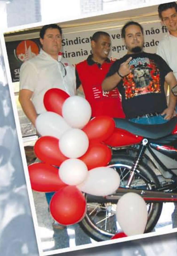
Muito chope, carne e brinquedos para as crianças fizeram a alegria das famílias presentes