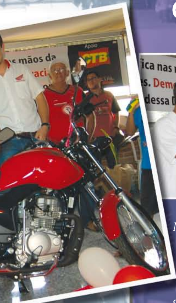
TRABALHADOR DA AG (PEDREIRA) LEVA A MOTO 0km DESTA EDIÇÃO