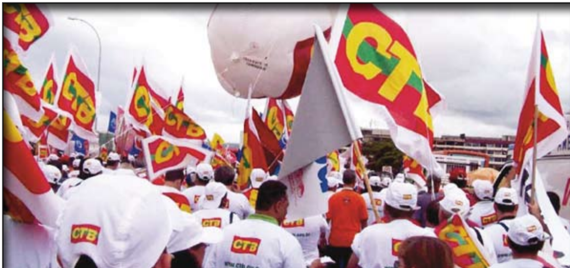
A CTB é uma central com o compromisso de resgatar a luta dos trabalhadores nos dias atuais

O ato do 1º de Maio Unificado, em São Paulo, foi marcado pela grande festa que reuniu milhares de trabalhadores e trabalhadoras, mas quem esteve na Praça Campo de Bagatelle também ouviu dos dirigentes sindicais uma série de questionamentos a respeito do atual cenário brasileiro. Para os dirigentes da CTB - Central dos Trabalhadores e Trabalhadoras do Brasil - presentes ao evento, o tema da desindustrialização e dos empregos qualificados esteve na pauta do dia.