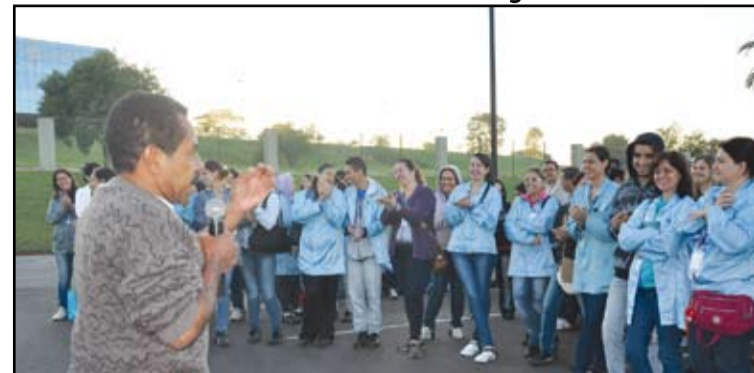
Trabalhadores cruzaram os braços durante 2h em protesto contra a empresa

A mobilização ocorreu após novas reclamações dos funcionários sobre uma série de problemas que eles vêm enfrentando na empresa. Desde que se instalou em Jaguariúna, no início do ano, a Teikon é alvo de várias denúncias dos trabalhadores, desde a má qualidade da comida servida até os excessos cometidos por líderes na produção, passando ainda por pressões para que eles façam